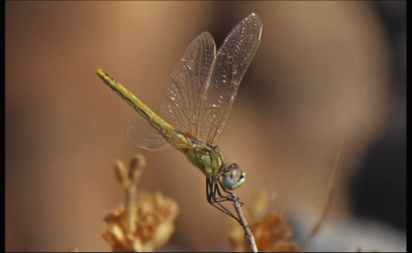
beim Dead's Gorge