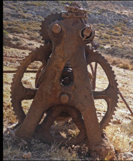
am Amato Beach bei Xerokampos