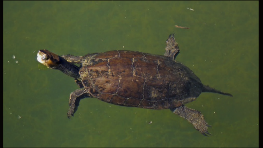
Wasserschildkröte im Palast der Minoer