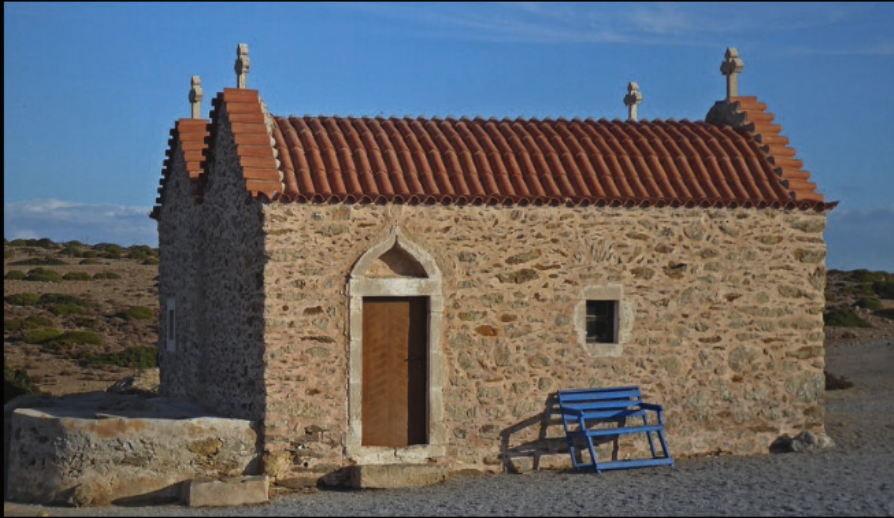
die blaue Bank