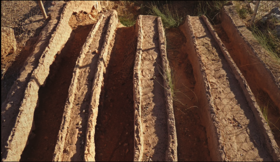
Teil des ersten Metall-Schmelzofens der Antike, im Palast der Minoer, ca. 1600 v.Chr.