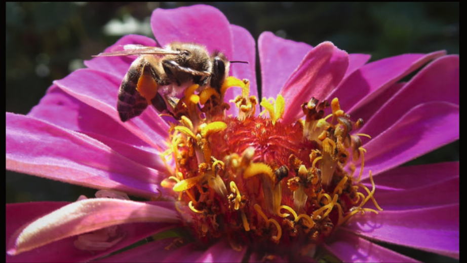
im Kloster Moni Exakoustis