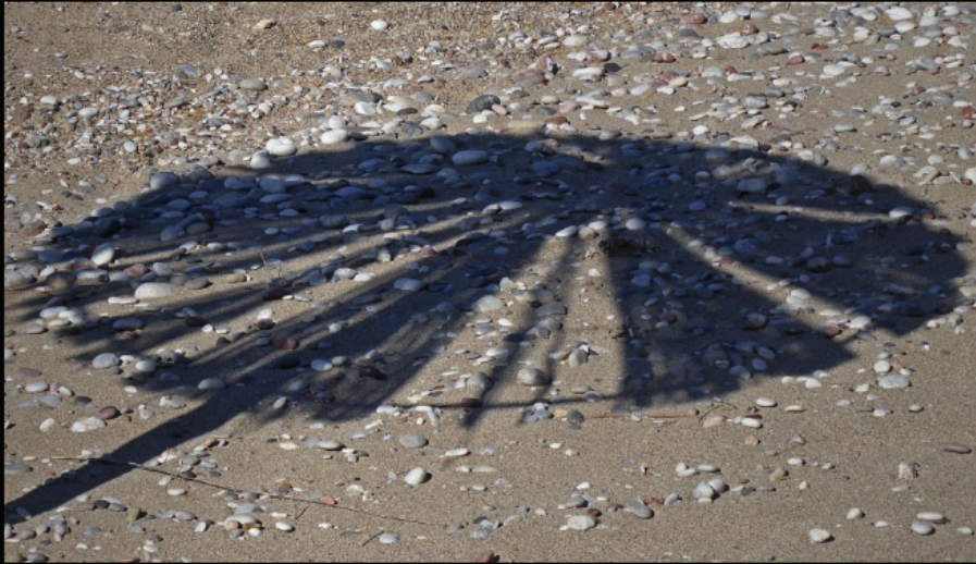
am Beach von Goudouras