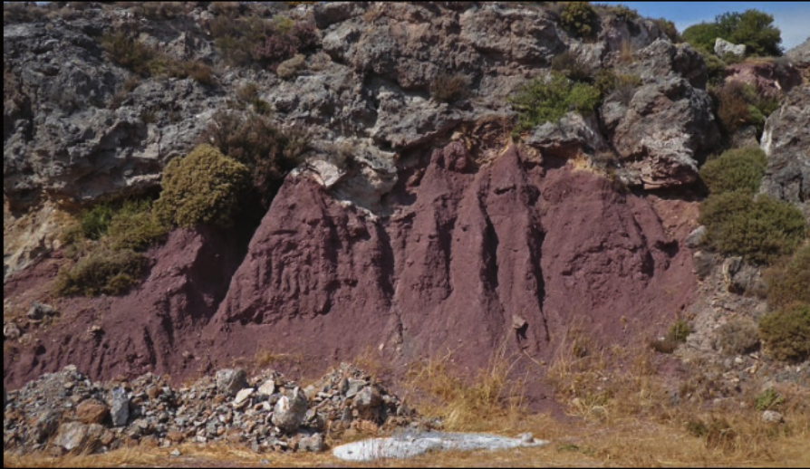
zwischen Zakros und Palekastro