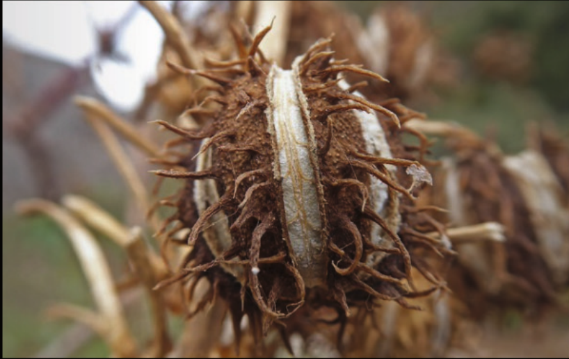
im Dead's Gorge