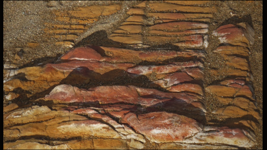
am Psili Ammos Beach bei Palekastro