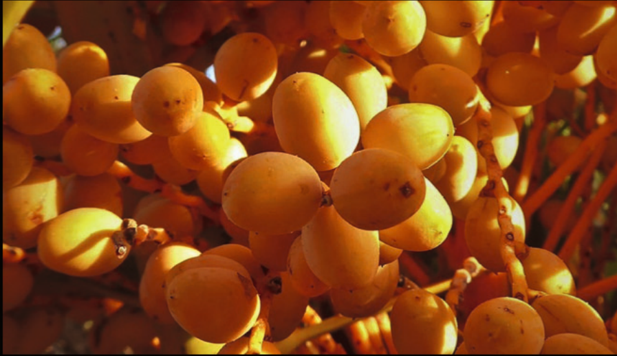
am Vai Beach