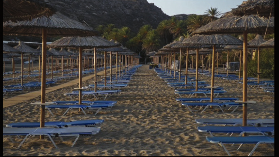
am Vai Beach