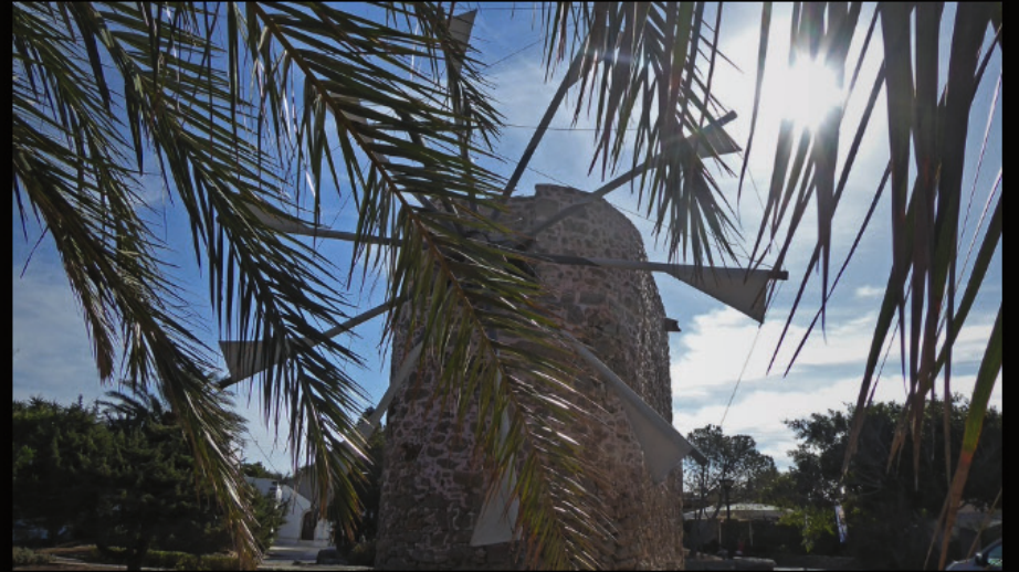
Windmühle beim Kloster Toplou