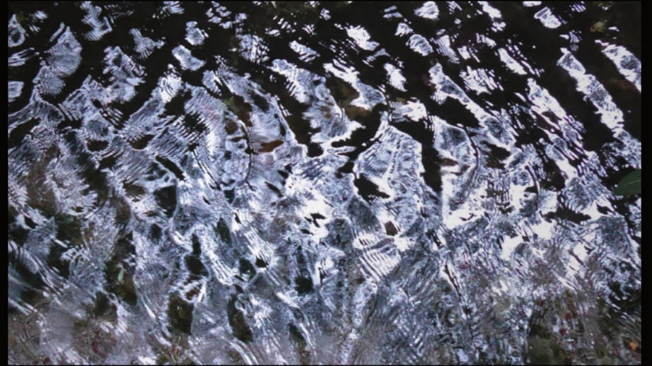
an der Quelle bei Zakros