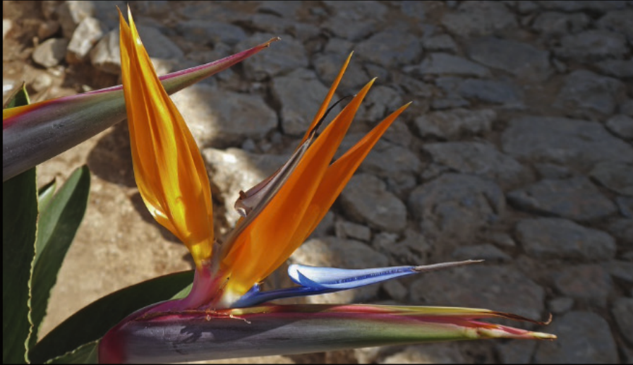
Strelitzie im Kloster Moni Kera Kardiotissa