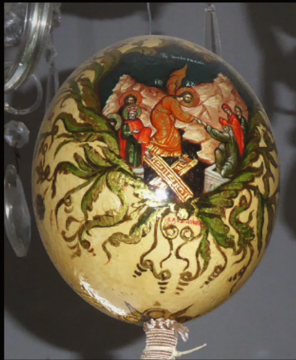
im Kloster Moni Exakoustis