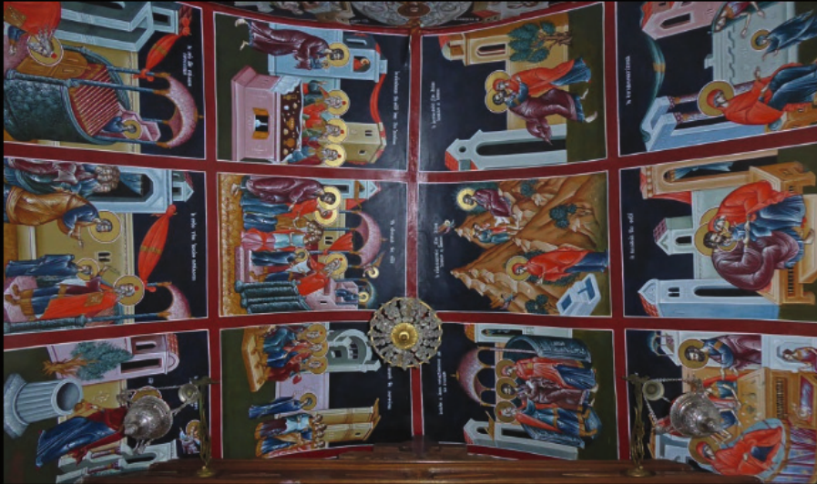
im Kloster Moni Exakoustis