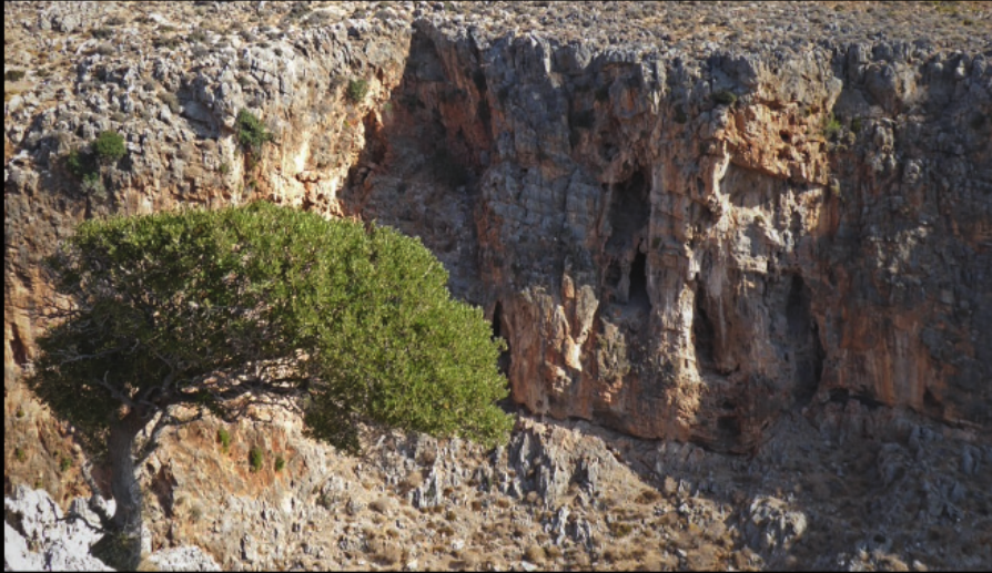
Dead's Gorge bei Kato Zakros