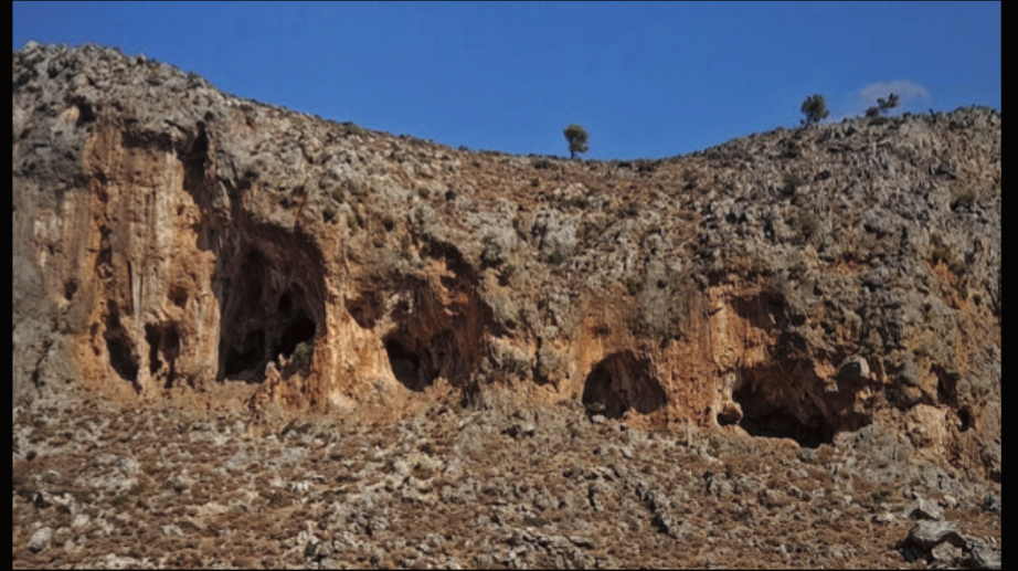
die Bestattung-Höhlen der Minoer im Dead's Gorge