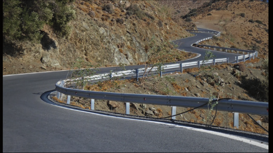
on the road