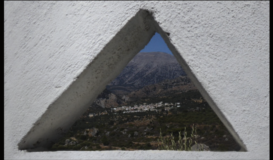
im Kloster Moni Exakoustis